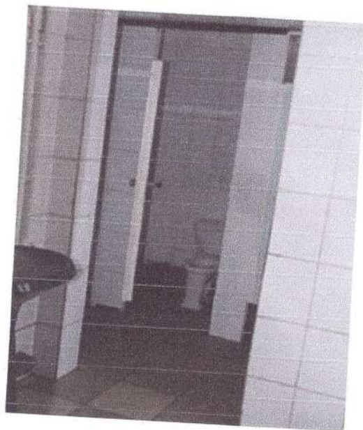
Фото 10 (Туалет в корпусе №2)