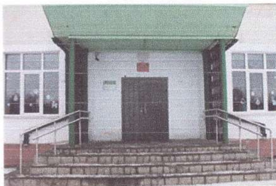
фото 2 (Вход в корпус №1)