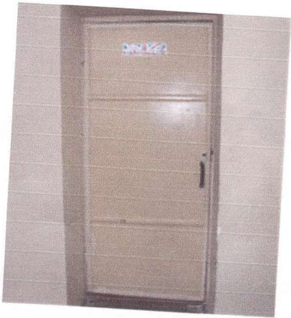
Фото 7 (Дверь учебного кабинета в корпусе №1)