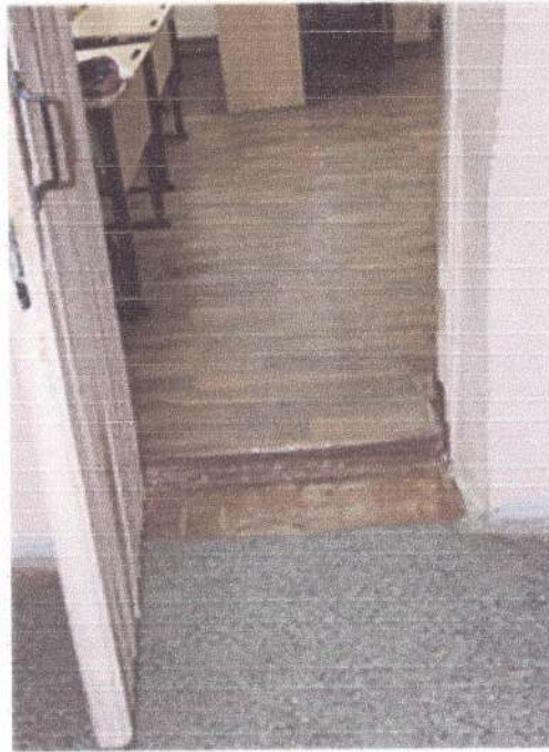
Фото 5 (Дверь учебного кабинета в корпусе №1)