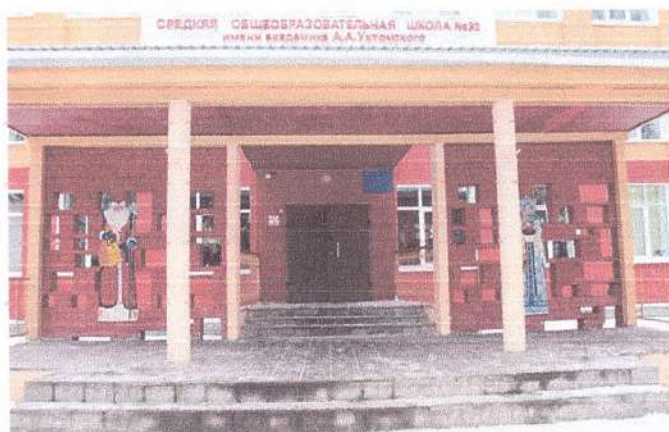
фото 3 (Вход в корпус №2)