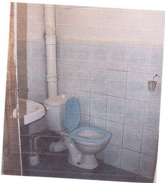
Фото 9 (Служебный туалет в корпусе №2)