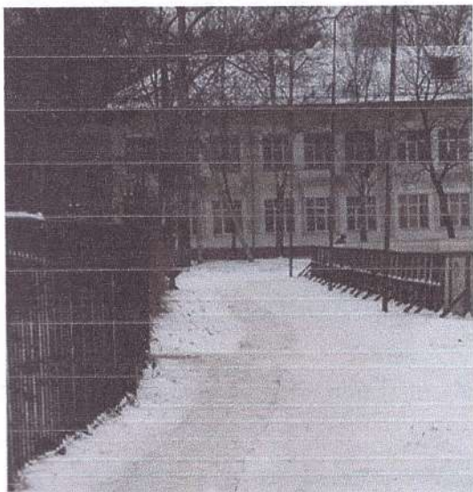
фото 1 (Территория, прилегающая к зданию)