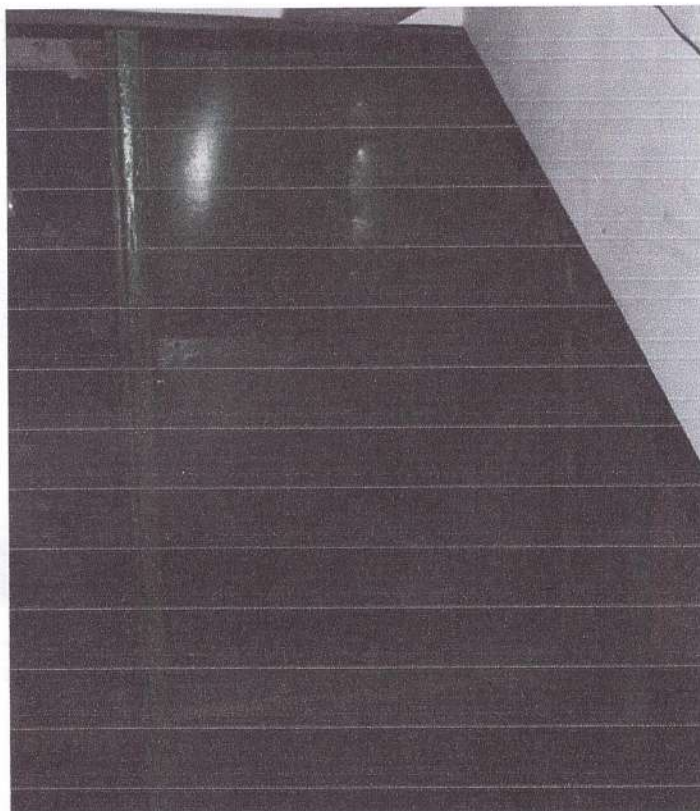
Фото 6 (Двери запасного выхода в корпусе №1)