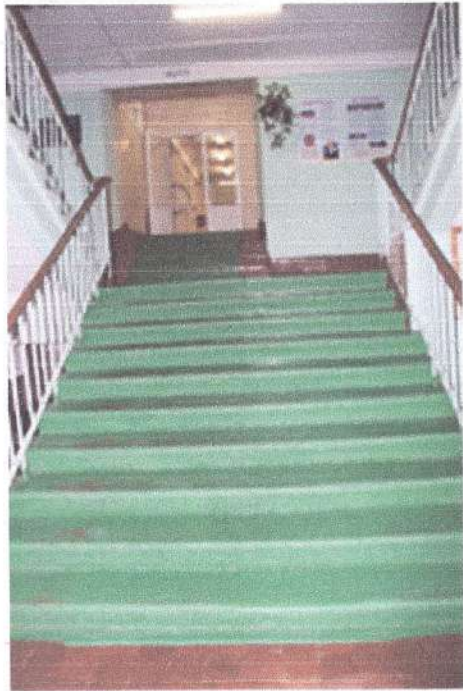
Фото 4 (Лестница в корпусе №2)